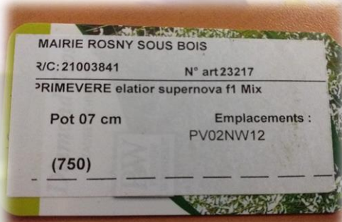
Etiquette servant à la préparation de commande.