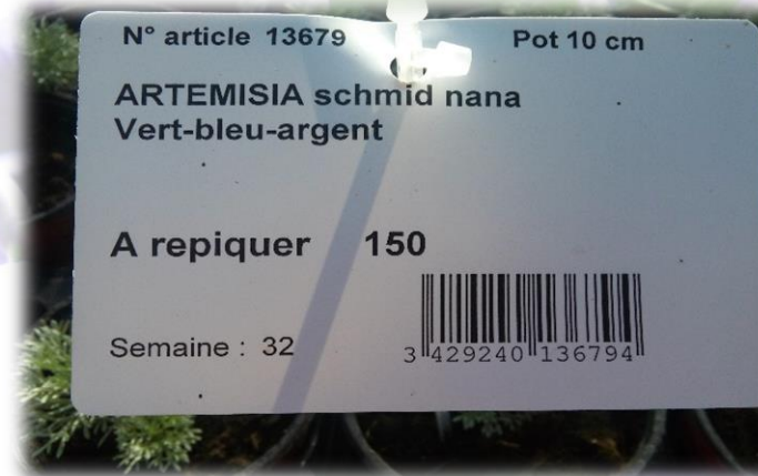
Etiquette de repérage piquée dans les serres.