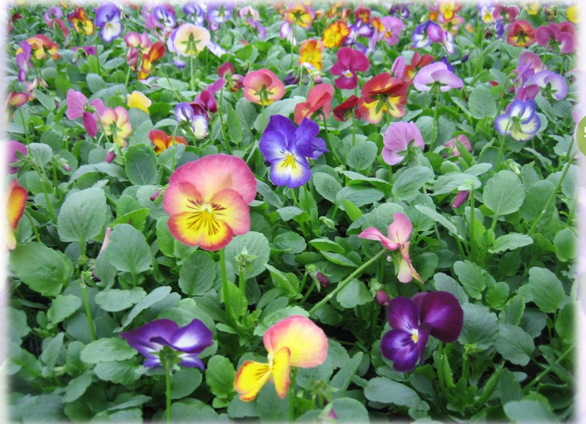
Pensée Ultima radiance mélange