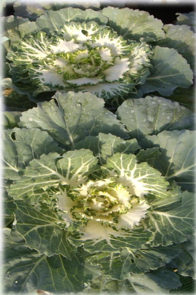
Choux lisse blanc