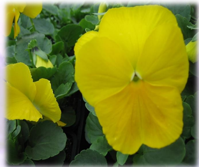
1. Topaz and Garnet Mix 2. Ocean Breeze Mix 3. Cassis Macule 4. Blanc pur et Morpheus 5. Jaune Pur