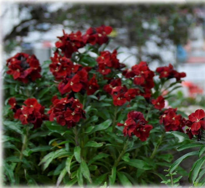
Giroflée ravenelle red