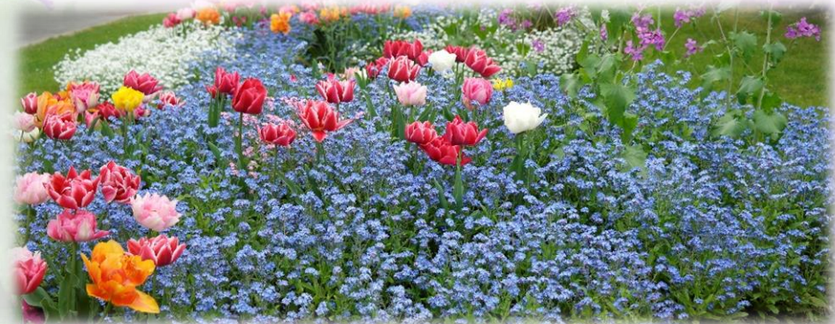
Myosotis Sylva bleu