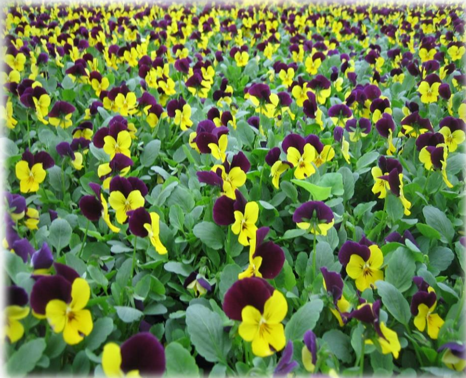
Viola sorbet yellow jump up