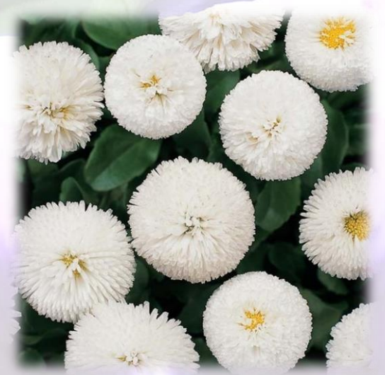
Paquerette bellissima blanc