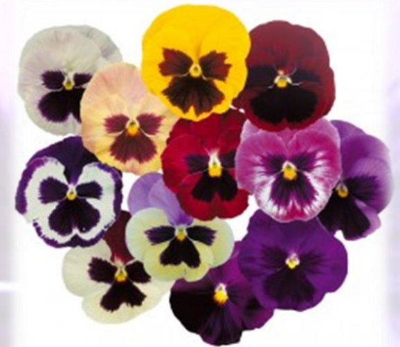
Pensée mélange macule (blotch mix)