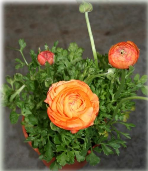
Renoncule magic orange