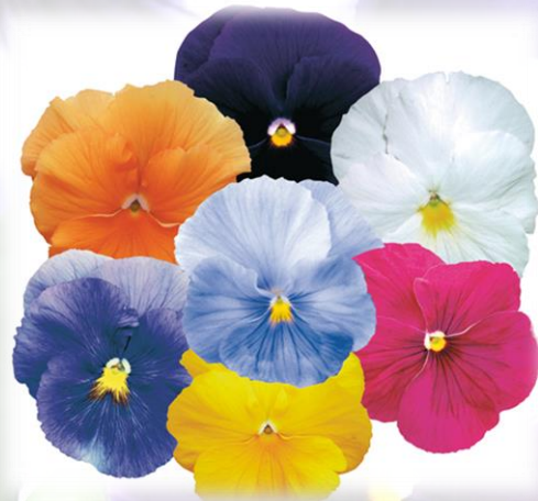
Pensée mélange pur