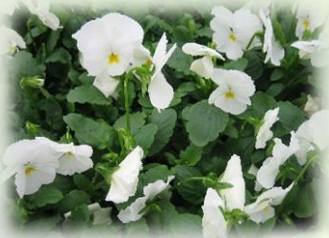
Viola sorbet blanc et beaconsfield